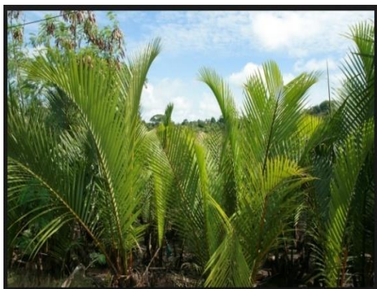
Gambar 2. Daun Nipah

Hasil yang didapat dari penelitian ini adalah sebagian masyarakat memanfaatkan hasil dari hutan mangrove seperti daun dari pohon Nipah, buah mangrove. Kemudian membuat inovasi dari pohon dan buah mangrove tersebut. Pemanfaatan hasil alam Hutan Mangrove oleh masyarakat lokal seperti pohon, daun, buah bahkan