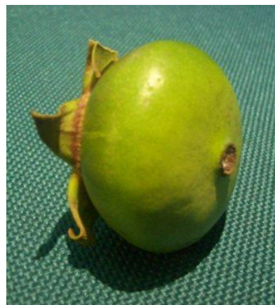
Gambar 3. Buah Mangrove

Jenis inovasi yang dilakukan masyarakat lokal terhadap SDA Hutan Mangrove, seperti daun nipah bisa dijadikan atap rumah, dinding atau kajang untuk perahu, tikar, aneka keranjang, caping, sapu lidi, serta sebagian dijadikan pucuk atau pembungkus rokok tembakau. Lalu Nira Nipah yang diambil diolah menjadi gula, sedangkan umbut nipah biasanya untuk dimakan. Masyarakat lokal memanfaatkan buah mangrove sebagai jus, manisan dan sabun cair yang mereka olah sendiri.